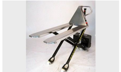
EHL 1004 RF-SEMI