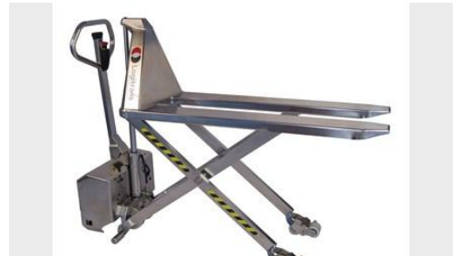
HL 1004 RF-SEMI